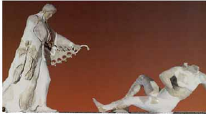
Η Αθηνά μάχεται με τον Εγκέλαδο. Από την παράσταση της Γιγαντομαχίας στον αρχαίο ναό της Αθηνάς, στην Ακρόπολη.

Όταν οι Θεοί του Ολύμπου πολέμησαν με τους Γίγαντες, η Θεά Αθηνά σκότωσε τον Εγκέλαδο πετώντας πάνω του το νησί Σικελία ή την Αίτνα. Η Γιγαντομαχία περιγράφεται με έντονα φυσικά φαινόμενα όπως σεισμούς, ηφαιστιακή δραστηριότητα και ρήγματα στο φλοιό της Γης. Κάθε φορά που γίνονταν σεισμός οι άνθρωποι πίστευαν ότι ο Εγκέλαδος ξυπνούσε και προσπαθούσε να ελευθερωθεί από το βάρος που τον πίεζε. Κι όταν θύμωνε και αναστέναζε από το βουνό Αίτνα πετάγονταν πυκνοί καπνοί και λάβα. Έτσι, οι άνθρωποι συνέδεσαν τον σεισμό με τον Εγκέλαδο, επειδή στη Σικελία γίνονται πολλοί σεισμοί και παράλληλα το βουνό Αίτνα είναι το πιο ενεργό ηφαίστειο της Ευρώπης από τα αρχαία χρόνια μέχρι σήμερα.